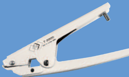
Spantang voor aardbeugels PLIOTER.